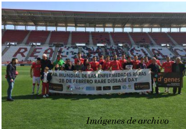
Imágenes de archivo